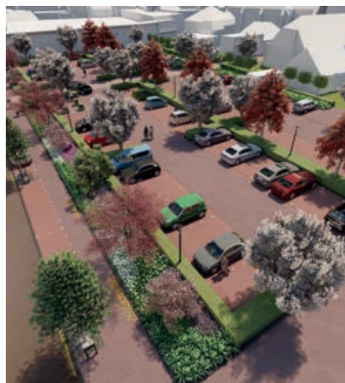
Een ander aanzicht van het nieuwe parkeerterrein (Bureau Hollema)

We hopen nog steeds dat de aannemer van de Albert Heijn in juni kan beginnen met de bouw van de tijdelijke supermarkt en dat deze eind van de zomer klaar is. In september zou de tijdelijke supermarkt dan open kunnen, waarna de sloop en nieuwbouw van de Albert Heijn kan starten.