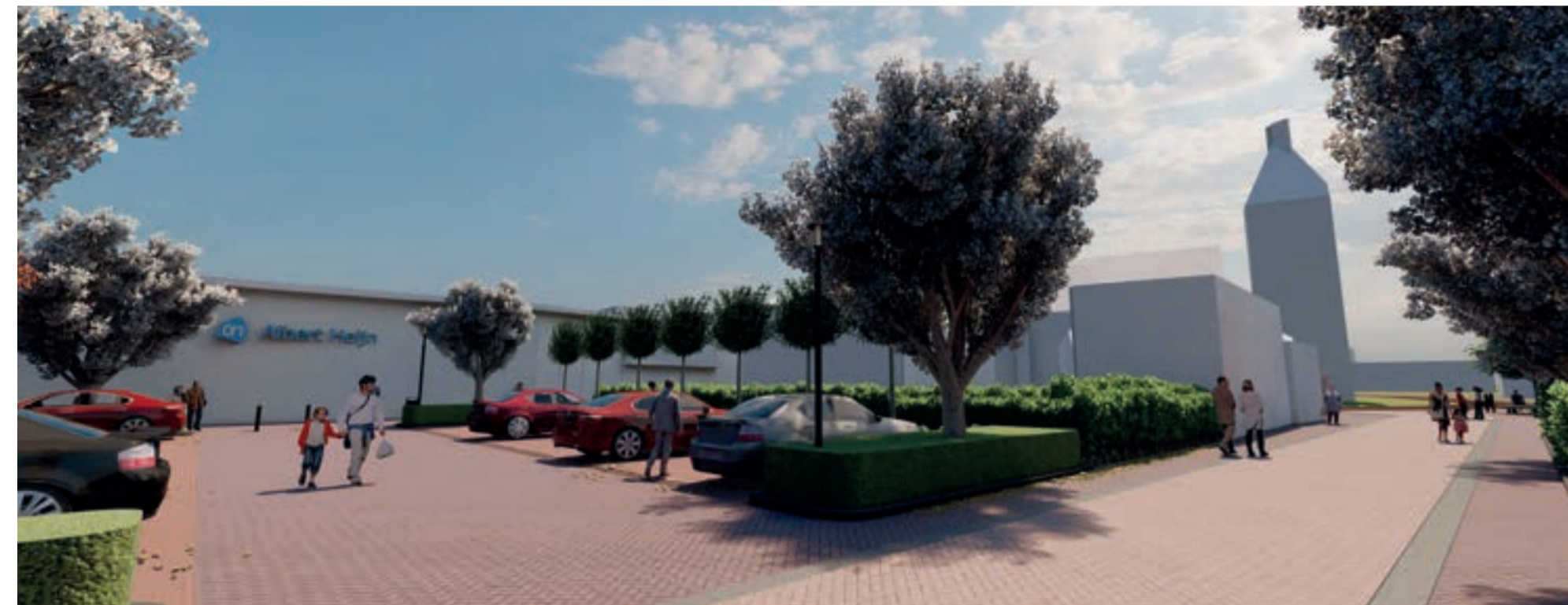
Een schets van het nieuwe parkeerterrein (Bureau Hollema)

In het centrum van Uithuizen is veel in de openbare ruimte in voorbereiding en van een deel start binnenkort de uitvoering. Allemaal met de bedoeling om de functie en uitstraling van het centrum te verbeteren. Met publiekstrekkingen aan beide uiteinden en daar tussenin vooral kleinere winkels. Hieronder leest u de laatste stand van zaken.