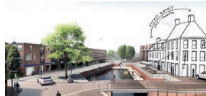
Conceptschets nieuwbouwpand op de vroegere SNS-locatie (Ziegler | Brandhorst)

We willen het Molenerf groener en duurzamer maken en onder andere een verbinding tussen de Snik en het Molenerf, het centrum aan de Blink en de Hoofdstraat maken. Daarmee maken we betere verbindingen en zichtlijnen in het centrum. Verder komt er op de vroegere SNS-locatie een aantrekkelijke nieuwe woonlocatie met appartementen en op de begane grond mogelijkheden voor horeca of detailhandel.